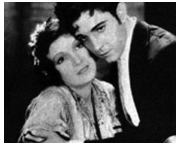
1930 LA SEVILLANA (Sevilla de mis Amores) de Ramon Navarro avec Conchita Montenegro