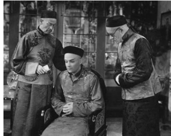
1932 DANS LA NUIT DES PAGODES (The Son-Daughter) de C. Brown avec Lewis Stone