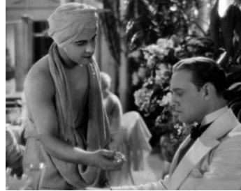
1931 LE FILS DU RAJAH (Son of India) de Jacques Feyder avec Conrad Nagel