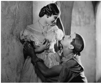
1926 ROMANCE (The Road to Romance) de John S. Robertson avec Marceline Day