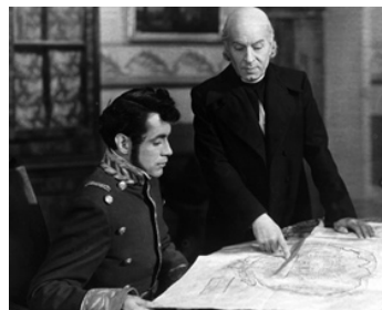
1942 LA VIERGE QUI FONDA UNE PATRIE (La Virgen que forjo una patria) de J. Bracho avec D. Soler