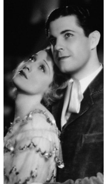
1933 LE CHAT ET LE VIOLON (The Cat and the Fiddle) de William K. Howard avec J. MacDonald