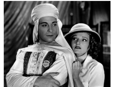
1936 LA FIANCÉE DU SHEIK (The Sheik steps out) d'Irving Pichel avec Dorothy Jordan