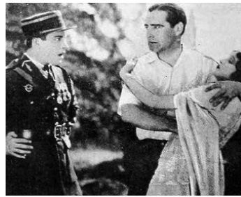
1922 TRIFLING WOMEN de Rex Ingram avec Rex Ingram, Barbara La Marr