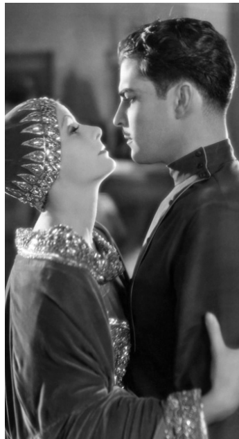
1931 MATA-HARI (Mata-Hari) de George Fitzmaurice avec Greta Garbo