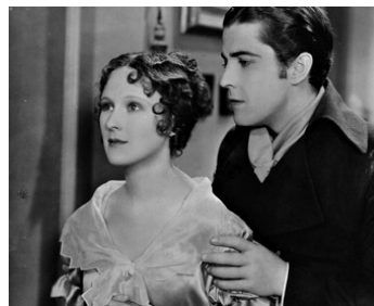
1929 LE LIEUTENANT SANS GÊNE (Devil may care) de Sidney Franklin avec Dorothy Jordan