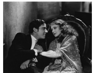
1930 IN GAY MADRID de Robert Z. Leonard avec Dorothy Jordan