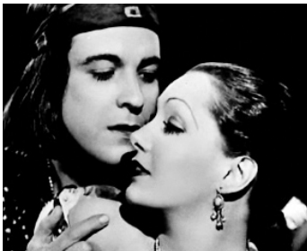
1934 LAUGHING BOY de W. S. Van Dyke avec Lupe Velez