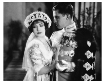
1928 LE SUPRÊME RENDEZ-VOUS (Forbidden Hours) de Harry Beaumont avec Renée Adorée