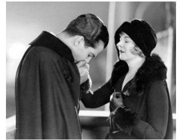
1927 LES AMANTS (Lovers ?) de John M. Stahl avec Alice Terry