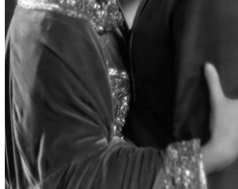
1931 MATA-HARI (Mata-Hari) de George Fitzmaurice avec Greta Garbo