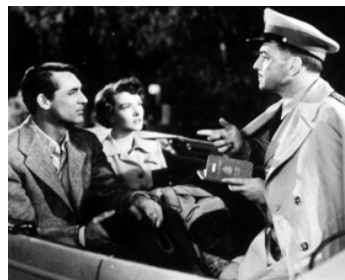
1950 CAS DE CONSCIENCE (Crisis) de Richard Brooks avec Cary Grant, Paula Raymond