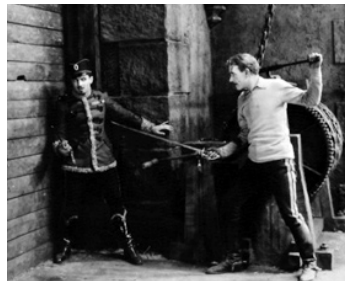
1922 LE PRISONNIER DE ZENDA (The Prisoner of Zenda) de Rex Ingram avec Lewis Stone