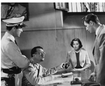
1949 ÇA COMMENCE À VERA CRUZ (The big Steal) de Don Siegel avec Jane Greer, R. Mitchum