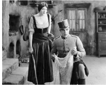
1924 GUERRITA (Thy name is Woman) de Fred Niblo avec Barbara La Marr