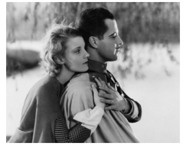
1931 L'AUBE (Daybreak) de Jacques Feyder avec Helen Chandler