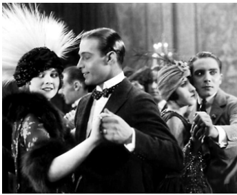
1921 LES 4 CAVALIERS DE L'APOCALYPSE (The four horsemen of the Apocalypse) de R. Ingram