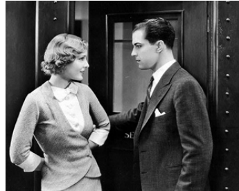
1933 LE BEL ÉTUDIANT (Huddle) de Sam Wood avec Madge Evans