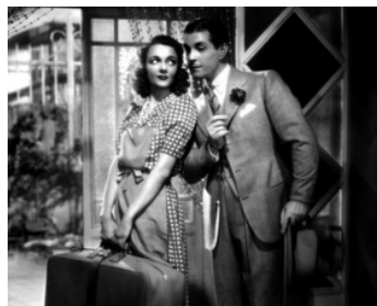
1940 LA COMÉDIE DU BONHEUR de Marcel L'Herbier avec Jacqueline Delubac