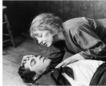
1924 LE LYS ROUGE (The red Lily) de Fred Niblo avec Enid Bennett