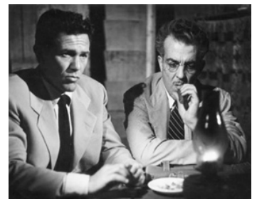
1949 LES INSURGÉS (We were Strangers) de John Huston avec John Garfield