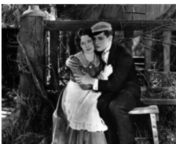
1927 LE PRINCE ÉTUDIANT (The Student Prince in Old Heidelberg) d'E. Lubitsch avec N. Shearer