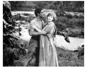
1923 LES CATARACTES DE LA MORT (Where the Pavement ends) de R. Ingram avec Alice Terry