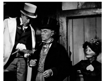
1960 LA DIABLESSE EN COLLANT ROSE (Heller in Pink Tights) de G. Cukor avec A. Quinn, S. Loren