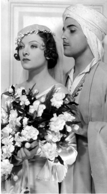
1932 LE CHANT DU NIL (The Barbarian) de Sam Wood avec Myrna Loy