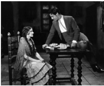
1930 LE CHANTEUR DE SÉVILLE (Call of the Flesh) de Charles Brabin avec Dorothy Jordan