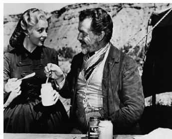
1950 LE CONVOI MAUDIT (The Outsiders) de Roy Rowland avec Arlene Dahl