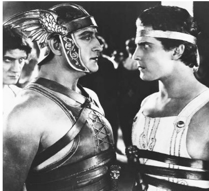
1926 BEN-HUR (Ben-Hur) de Fred Niblo avec Francis X. Bushman