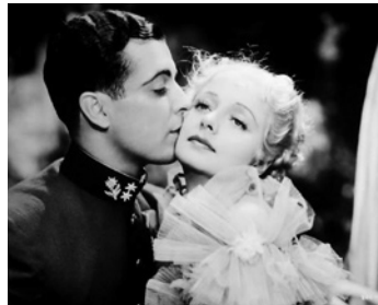
1934 LA CHANSON DE LA JEUNESSE (The Night is young) de Dudley Murphy avec Evelyn Laye